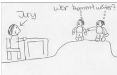
Abb. 1: Eine Situation, bei der GNTM -Fans besonders mitfiebern: Die Entscheidung (Mädchen, 13 Jahre)

Die Sendung erhält ihre hohe Bedeutung und eröffnet Anschlussmomente für die jugendlichen RezipientInnen vor allem dadurch, dass es sich hier aus der Perspektive der Kinder und Jugendlichen um eine Abbildung der