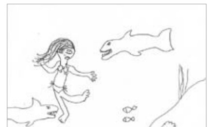
Abb. 3: Bewunderung für große Leistung: Schwimmen mit Haien (Mädchen, 12 Jahre)