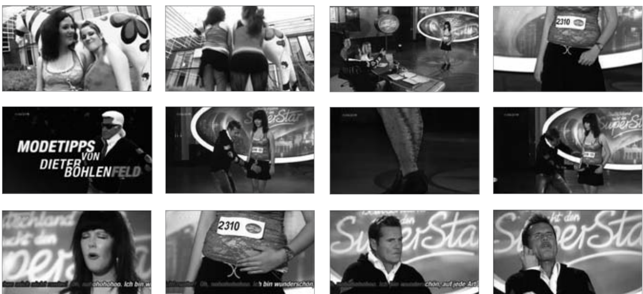
Screenshots 5-16 (Sendung 28.01.2009): Deutschland sucht den Superstar , Porträt einer 17-jährigen Bewerberin: im Medientext durch Kameraraführung (voyeuristisch-abwertende Untersicht), Animation (z. B. behaarte Beine), Schnitt (nur kleinste Interviewausschnitte) und Tonebene (z. B. Schmatzgeräusche) angelegte Deutungsmuster

Der Beitrag ist durch seine Kameraperspektive, den Schnitt und die Tonebene stark und eindeutig interpretierend. Die Inszenierung legt gezielt Degradierung und Abwertung der jungen Frau nahe. Was hier angeboten wird, hat mit der Realität oder