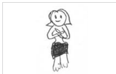
Abb. 2: Abgleichen von Werten: Nacktphotoshooting. »Ich dachte nur, dass ich so was nie machen würde ...« (Mädchen, 16 Jahre)